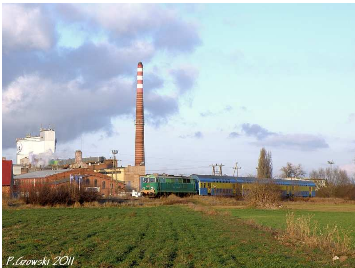
Fot. 24. Wyjazd pociągu z Miejskiej Górki. W tle Cukrownia "Miejska Górka"

powrotną. Przed nami było jeszcze do przejechania kilka kilometrów szlaku i kilka postojów. Pierwszy chwilę po ruszeniu zaplanowano tak aby można było uwiecznić pociąg z cukrownią i kościołem w tle. W tym przypadku bardziej przydatny mógł się okazać obiektyw szerokokątny (fot. 24).