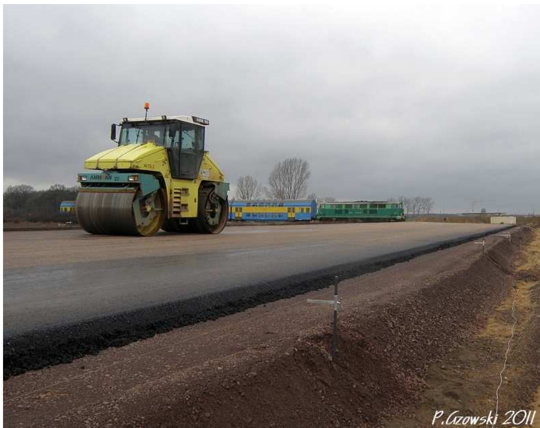
Fot. 17. „Fiat” przecina ślad nowej drogi S5.