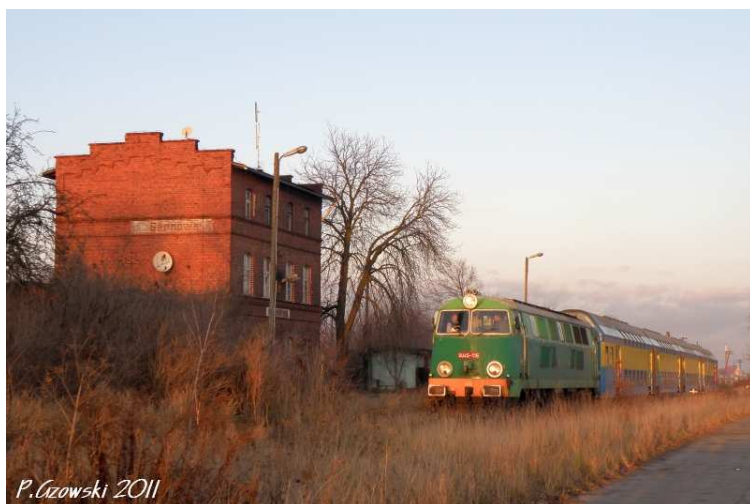
Fot. 27: Ostatnie ujęcie z Miejską Górką na drugim planie.