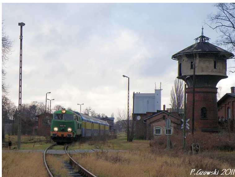
Fot. 10: Pociąg specjalny opuszcza stację w Górze Śląskiej.