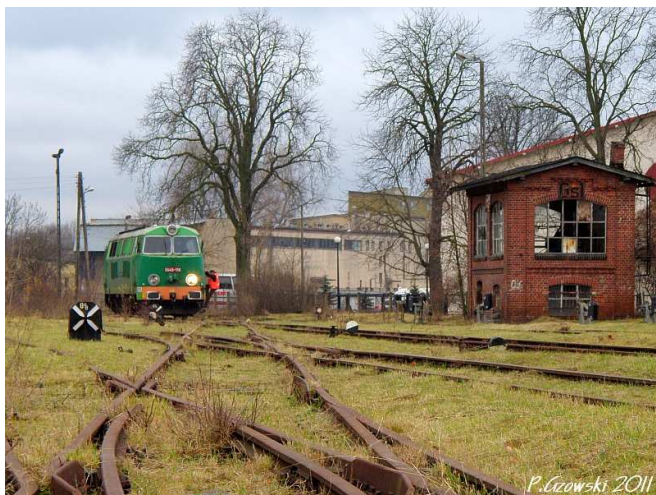
Fot. 7: Manewry rejonie nastawni Gs1

elementy kolejowego krajobrazu większej stacji. Do dyspozycji uczestników wciąż były: czterostanowiskowa parowozownia z dodatkowymi budynkami i wieżą wodną, budynek dworca, dwie zachowane nastawnie wolnostojące, sygnalizacja kształtowa (niestety były to semafony z już tylko bezsilnie wiszącymi ramionami), rampa, wskaźniki etc. Zachęteni porządkiem na stacji i przyciętą roślinnością uczestnicy spenetrowali cały jej obszar. Oczywiście w międzyczasie trwała zmiana czoła pociągu, jednak już sama w sobie ciekawa stacja stanowiła wielką atrakcję.