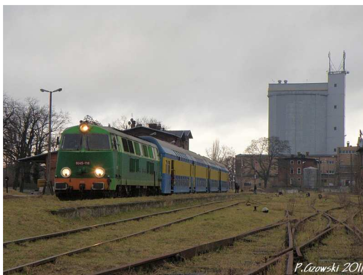
Fot. 8: Pociąg gotowy do odjazdu w kierunku Bojanowa