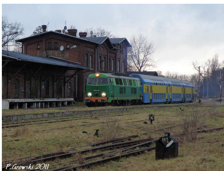
Fot. 9: Najazd składu w kierunku Bojanowa jeszcze w rejonie dworca.