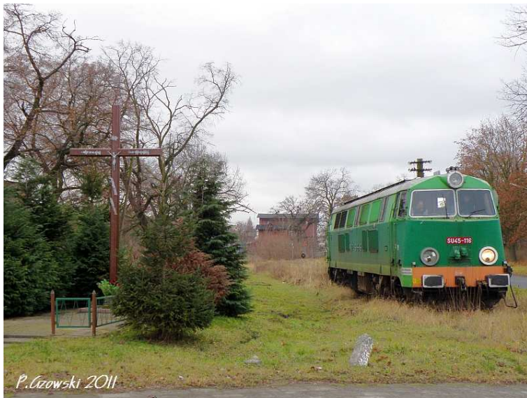
Fot. 6: Dalej już nie pojedziemy. Km 15,47.

dworcem) dotarliśmy do Góry Śląskiej (fot. 5). Trudno powiedzieć ile zdjęć powstało w ciągu naszego pobytu na tej niezwykle klimatycznej stacji. Miejsce naprawdę godne uwagi, obfitujące w (jeszcze) zachowane