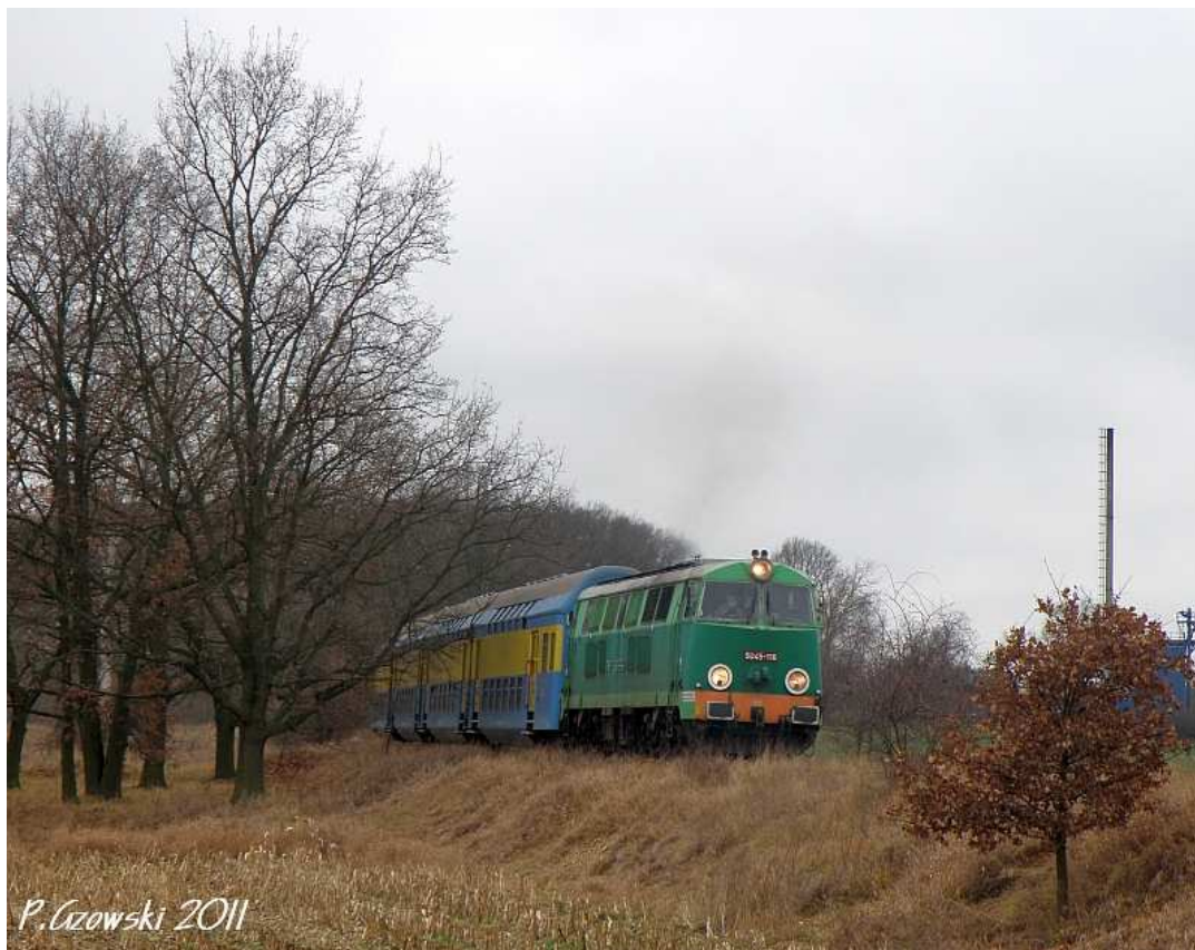
Fot. 16. Pociąg specjalny relacji Góra Śląska - Bojanowo minął Zaborowice.

siana. Ja skusiłem się na ujęcie pociągu niejako wjeżdżającego przed pracującym walcem na nowo wylany asfalt (fot. 17).