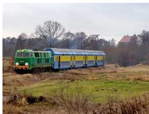
Fot. 12: Fotostop przy osadniku - w tle kościół w Górze Śląskiej.

Nadszedł czas rozpoczęcia jazdy powrotnej. Przed nami prawie 15 kilometrów szlaku i 6 fotostopów. Wszystkie składały się cofnięcia składu i najazdu. Wszyscy zatem mogli w czasie jednego postoju wykonać zdjęcia z kilku miejsc, jeśli tylko sprawnie się przemieszczali. Taki plener zorganizowano przy