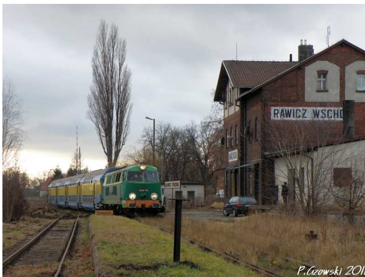
Fot. 19. Fotostop w pobliżu oczyszczalni ścieków w Rawiczu