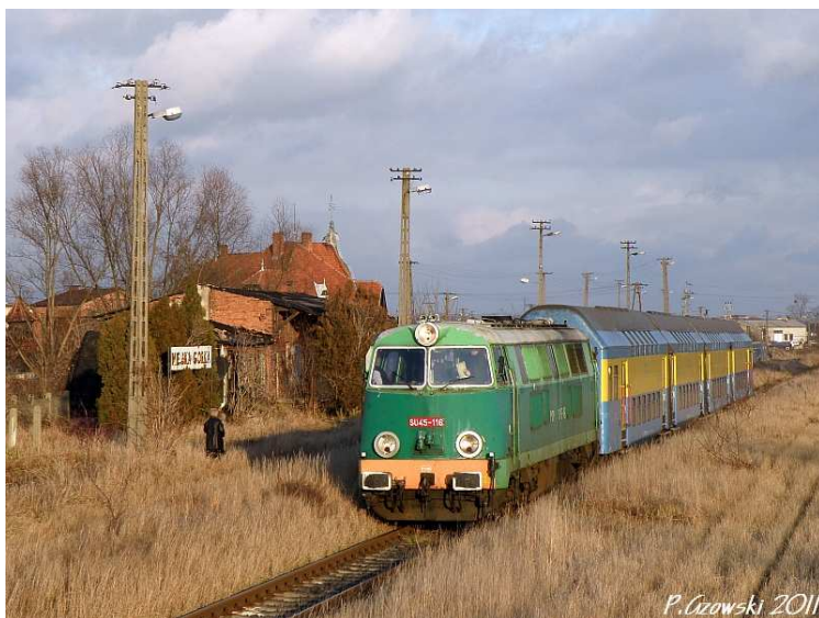
Fot. 22. Manewrująca lokomotywa na wschodniej głowicy stacji.