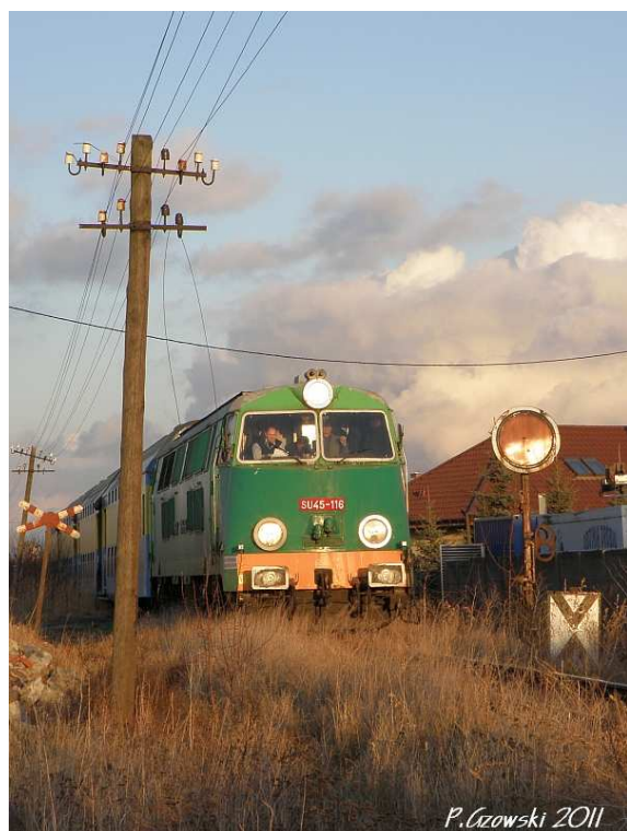
Fot. 25. Miejska Górka - tarcza ostrzegawcza od strony Rawicza.

Na kolejny plener udaliśmy się pieszo. W tym przypadku organizatorzy postanowili rozruszać uczestników – do przebycia było ok. 300 m w rejon tarczy ostrzegawczej. Pociąg miał być fotografowany właśnie z nią, jednak okazało się, że „obowiązkowe” miejsce niezbyt sprzyja takim działaniom (fot. 25). Tarczę można było uchwycić jedynie na tle czerwonego dachu, obok piętrzyła się sarta kamieni a nad całością przewieszony był czarny przewód. Więcej możliwości być może dawało ujęcie wzdłuż toru, ale na to z kolei nie było zbyt wiele miejsca. No cóż... Nie można mieć wszystkiego. Następnym fotostopem odbył się kilkaset metrów dalej. Za tło posłużył znów kościół i cukrownia. Tutaj z kolei postanowiłem poeksperymentować z cieniami zwykle usuwanymi z kadru. (fot. 26).