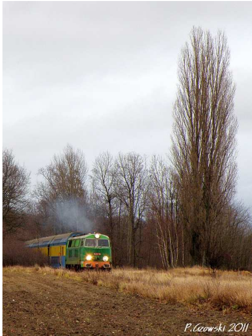
Fot. 4: Borszyn Wielki - najazd