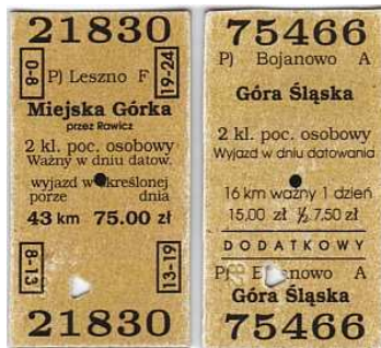
Powyżej: pamiątkowe bilety, obok: okolicznościowy folder.

Do Leszna dotarłem z Alicją ok. godziny 7.00. Po wykonaniu szybkiego rekonesansu w pobliżu dworca (zakupy) lokujemy się w bipie . Było jeszcze ciemno gdy powoli do składu wsiadali kolejni uczestnicy. Inni zanim to uczynili wykonali pierwsze zdjęcia pociągu, jeszcze w