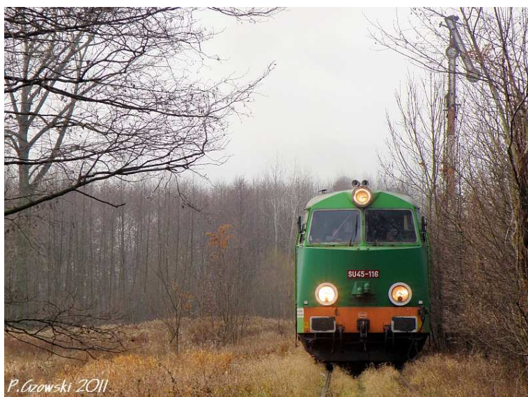
Fot. 11: Ostatnie ujęcie z semaforem wjazdowym od Zaborowic

osadniku jeszcze z widokiem na kościół w Górze, który dobrze wzbogacał kadr. Co sprytniejsi zapewne uchwycili także scenkę rodzajową na przejeździe z rowerzystą i fiatem w roli głównej. Niestety, mnie zdjęcia w tym miejscu zupełnie się nie udały (fot. 12).