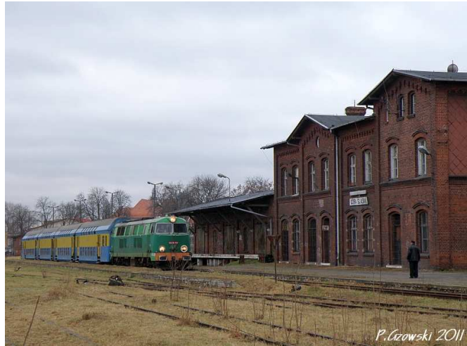
Fot. 5: Góra Śląska - „pociąg z Bojanowa wjechał na tor pierwszy przy peronie pierwszym....

dworcem) dotarliśmy do Góry Śląskiej (fot. 5). Trudno powiedzieć ile zdjęć powstało w ciągu naszego pobytu na tej niezwykle klimatycznej stacji. Miejsce naprawdę godne uwagi, obfitujące w (jeszcze) zachowane