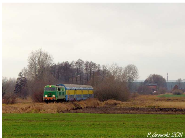
Fot. 15. Fotostop przed przystankiem Borszyn Wielki.