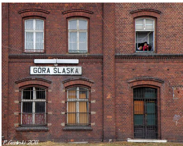
Fot. 7: Fasada dworca

Sygnał do odjazdu zmobilizował wszystkich i grupa przesunęła się w kierunku wieży wodnej aby w zorganizowanym fotostopie zarejestrować odjazd naszego pociągu pomiędzy peronów. Powagi kadrom dodawał górujący nad stacją wspomniany wcześniej zbiornik cukrowni. I znów aby zaspokoić fotograficzne potrzeby sympatyków kolei skład wycofano aż za semafony wyjazdowe w kierunku Odrzycka po czym wykonano najazd (fot. 9). Jedynym problemem tego wspianego pleneru stała się aura podnosząca poprzeczkę foto-amatorom. Zmienne